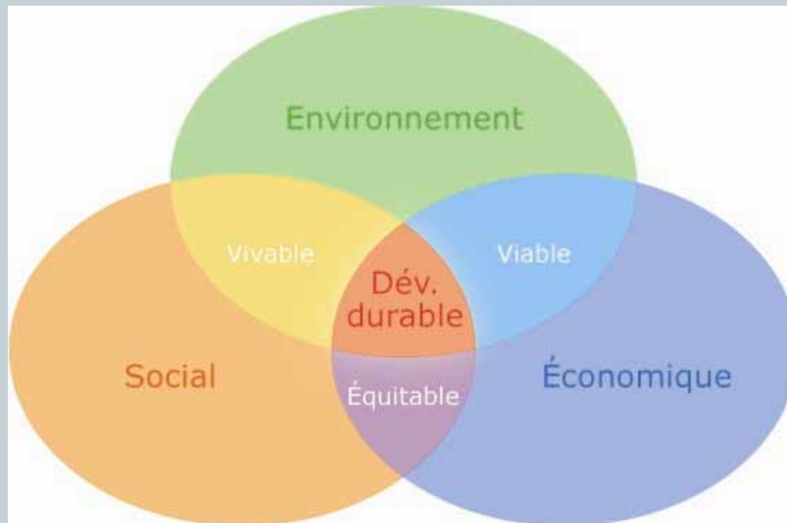
Schéma du développement durable