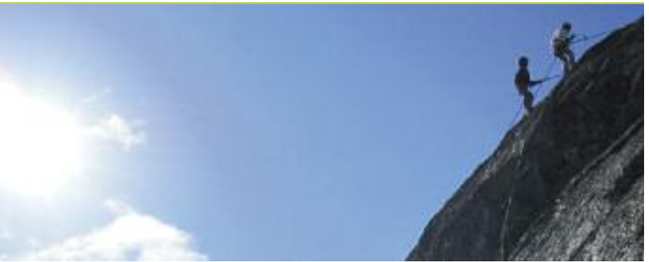
Escalade au Nunavik