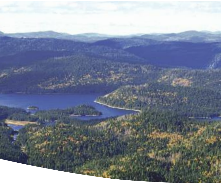
Réserve faunique Ashuapmushuan, Saguenay-Lac-Saint-Jean